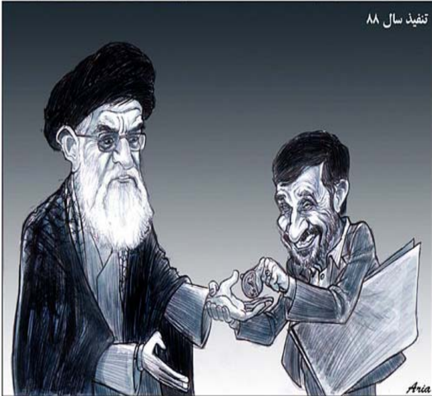
تنبه‌ذ سال 88

ئه‌وه‌ که‌سایه‌تییه‌نه‌ له‌ نامه‌یه‌که‌دا ده‌لێن: وا مه‌زانن ئێوه‌ له‌ بێر کراون، وره‌تان به‌رز بێ و هیوا براو مه‌بن چونکی دنیا ده‌زانن که‌ سه‌نه‌وه‌ی ساددی و مه‌عنه‌وسی جیهان پێوه‌ندی به‌ مانه‌وه‌ی ئێوه‌ هه‌یه‌.