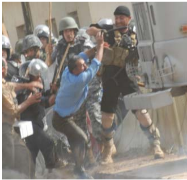
بریندارن و ژماره یه کیش به باریتمه گپرون. به دواي ئه م په لاماردها، دانیشتوانی که مپ مانیان له خواردن گرتوه و دوا ده کهن: ۱- هه چپی زووتر پۆلیسی عیراق و سه رجه م

مرۆفدۆسته کان و میدیاکانی جیهان بدری سهردانی ئه م که مپه بکن. پتویسته ده ولته تی عیراق و، هیزه کانی ئه مریکا به پرسیایه تیبه سیاسی، ئه خلاقی و مرۆیه کانی خویان له پیوه ندی له گه ل هه زاران که س له دانیشتوانی بیدیفاعی ئه م که مپه دا، له بیر بی و نه هیلن گیان و ئه منیه تی ئه و که سانه به م جۆره په لاماران، یا به هوی ته حویلدا نه وه ی زۆره ملی به ئیران، بکه ویتته مه ترسی.