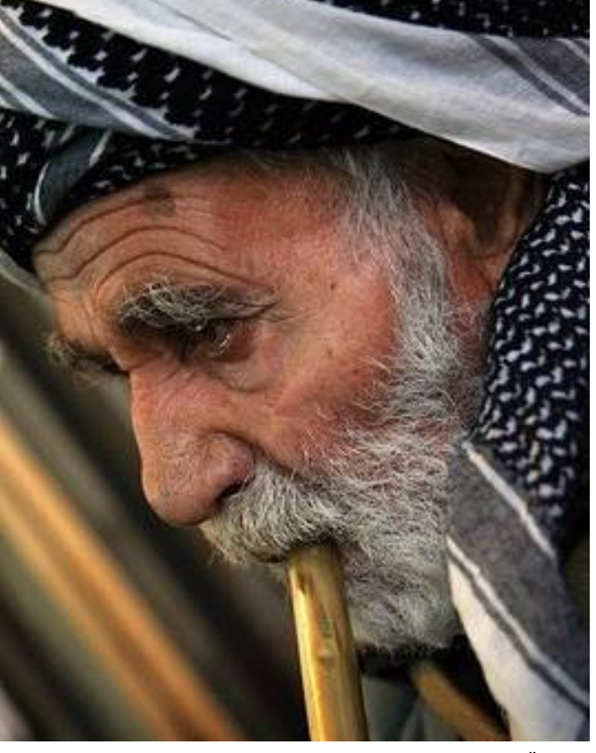
خه لکی قه در زانی کوردستان! بنه ماله ی هونه رمه ندی نه مر قاله مه ره! له ده ستپیکى مانگی جۆزه ردانی ئه مسالدا، هونه رمه ندی گه وره، قادر

حیزبی دیموکراتی کوردستان کۆمیسییۆنی راگه یانند ۲ى جۆزه ردانی ۱۳۸۸