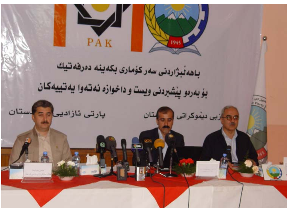
باهه ئبژاردنی سه ر کۆماری بکه ی نه ده رفه تیگ بو به ره و پیشبردنی ویست و داخوازه نه ته وا یه تییه کان

له به یاننامه یه کی هاویه شدا که ده فته ری سیاسی حیزبی دیموکراتی کوردستان و پارته ئازادی کوردستان، رۆژی ۹ی جۆزهردان له پیوه ندی له گه ل ده یه مین هه ئبژاردنی سه رکۆماری له ئیراندا بلاویان کرده وه، هه ر دوو حیزب داوا ده کن ئه م هه ئبژاردنه بکریته ده رفه تیگ بو پاشه کشه به سه ره رۆی و، بکریته سه ره تابه ک بو پیکه پنانی گۆپان له که شه وه ای سیاسی ئیراندا.