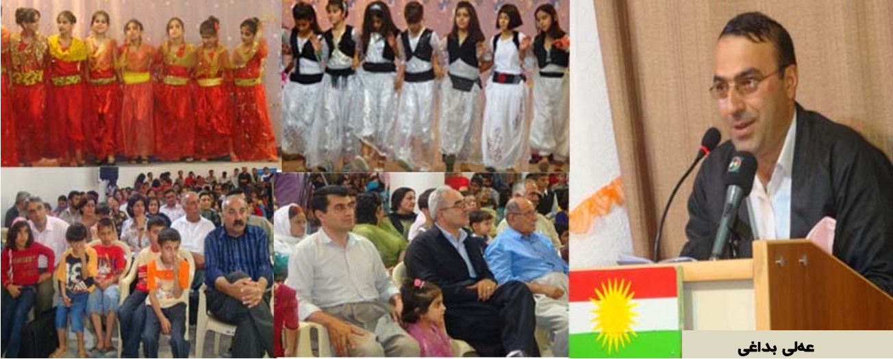
عه لی بداغی

خویندن دینن. ئه مپۆکه به هه زاران مندال به هۆى تاوانکارییه وه له گرتوو خانه کان دا ته مه نی مندالیان تیپه ر دهکەن و تیشیان دا