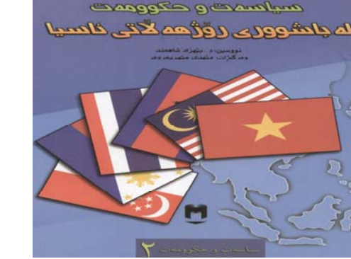
سیاسه‌ت و حکومه‌ت له‌ باشووری رۆژه‌لاتی ناسیا ناوی نووسه‌ر: د. بێژاد شاهه‌ند وه‌رگێژان: مه‌هدی مه‌هه‌ره‌روه‌ ناوه‌ندی بلاو کردنه‌وه‌: ده‌زگای موکریان