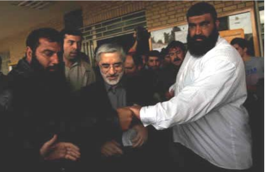
ناسیه‌ هۆکارو میر غه‌زه‌ب له‌ گه‌ڕانه‌وه‌ی خۆیاندا

له‌ ژووهرکه‌م خه‌ریکی کار بووم و بېرم له‌ هه‌لبژاردنه‌کانی سه‌رکۆماری ئێران له‌ مانگی جۆزه‌ردان‌دا ده‌کرده‌وه‌، که‌ له‌ ناکو هاوڕێیه‌کم له‌ حالیکدا، وینه‌یه‌کی به‌ده‌سته‌وه‌ بوو هاته‌ ژووهره‌وه‌ و وینه‌که‌ی پێشان دام. گوتم: ئه‌ی هاوار ئه‌وه‌ کییه‌؟ گه‌راوه‌ و گوتم: به‌ خوا سه‌یری؟ کاکه‌ ئه‌وه‌ میرحسین مووسه‌وی پالێوراوی ریفۆرمخوازه‌کانی کۆماری ئیسلامی بۆ هه‌لبژاردنه‌کانی ئه‌و خوله‌یه‌ .