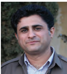
ئاسۆى حەسەن زادە

يەك دوو رۆژ پاش بلاووبوونەودى ژمارەى پېئىشوى رۆژنامەى «كوردستان»، قەلای دېموكرات لە شەوى يەلدا و لە كاتى جەژن گرتنى يادى لەدايكبوونى د. قاسملوودا بوو بە ئامانجى تىرۆرېزمى نوڤى كۆمارى ئىسلامى. ئەو كردهو تىرۆرېستىيە لە راستىدا جىبەجىكردى ھەرەشەكانى چەند مانگى رابردووى كاربەدەستانى رېژىم لەپۆئەندى لەگەل حزوروى پېئىشمەرگەكانى ديموكرات لەسەر سنوورەكان و لە نيوخۆى ولاتدا بوو. وپراى ريسوا كردنى ئەو جىنايەتە، پاشماوى ئەم وتارە پېئىشكەش بە رووحى پېرۆزى شەھيدانى «يەلداى خوئناوى ديموكرات»، بەتايبەتى فەرماندەى شەھيد اعلى قۇبتاسى دەكەم كە قارمانىكى مەيدانى خەبات و خۆراگرېي چەكدارى بوو.