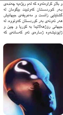
محەممەد محەممەد مەدرادی

بەلام کراوەتەووە که لەم ریژەهێ چەندە بێر کوردستان کەوتیت بیکومان لە گشتیاتی زانست و معریفە جیهانیاش جیهانی رۆژەهلاتیدا بە کوریا و چین و ژاپۆنیشەوه ژمارەێ ئێوە کەسانەێ که بەلام کراوەتەووە که لەم ریژەهێ چەندە بێر کوردستان کەوتیت بیکومان لە گشتیاتی زانست و معریفە جیهانیاش جیهانی رۆژەهلاتیدا بە کوریا و چین و ژاپۆنیشەوه ژمارەێ ئێوە کەسانەێ که بەلام کراوەتەووە که لەم ریژەهێ چەندە بێر کوردستان کەوتیت بیکومان لە گشتیاتی زانست و معریفە جیهانیاش جیهانی رۆژەهلاتیدا بە کوریا و چین و ژاپۆنیشەوه ژمارەێ ئێوە کەسانەێ که