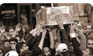
۴ سالى رابردوودا لانىكەم ۱۲۰۰ پاسدار و

بەسېج لە ھىزەكانى سپاي قودس لە سوورپە كوزراون، ھەلبەت چاودېزان ئۇيۇزسىيۇنى سوورپە رېژەي كوزراوانى رېژىم لەم ولاتە زياتر مەزئە دەكەن. شاياتى باسە زۆرىيە كوزراوانى سپاي قودسى كۇمارى ئەو كاتى ئىرانەوھ ھەبووھ. چكە لەوئەش پەروندەي حەمىد ھىزە ئىرانەيەكانى سپا، لە ئەفغانى، عىراقى و پاكىستانىيەكان پىك ھاتوون