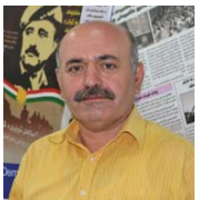
رهنه مه مه ده مینی

ولاته که ی و بو ته پینش نیۆ و تارخوین. هه رچه پنه هیرش و ئاگر تیبه رانهی بالۆیخانه ی عه ره بیستان له تاران له لایه حه سن رووه کانی و به شیکه له به ره پرسیانی نزیک له ده وه ته وه مه حکووم کرا و ته نانه ت و هک بۆخیان ده لێن ۵۰ که سپیکشیان قوولاسته کردوه، به خاله ش ئه و ده ست درۆژی یه بی وه لام نه مایه وه هه مسو پیوه ندی یه کانی خۆی له گه ل کۆماری ئیسلامی پچراندو ۴۸ کاتۆماری ده رفه ت دا به بالۆی و به ره پرسیانی ئیژرانی که خاکی ئه و و لاتانه به جی بیلن. به یه کی ته و لاتانی عه ره بی و زۆره یی ئه و ده ست درۆژی یه کانی عه ره بیستان هیرش بۆ سه ر بالۆیخانه ی ئه و و لاتانه به حه ره یین و سووانیش پیوه ندی یه کانی سیاسی یه کانی ئه مریکایه یه کترووه کانی شاستی پیوه ندی یه کانی له گه ل کۆماری ئیسلامی دابه زاند. له به ینه دا ئه مریکا و یه کیه تیی ئوروپا ش رایان گه یاندوه له گه ل قوول بونه وه ی گرژی یه کانی ئه و و لاتانه نین و خاویارن پیوه ندی یه کانیان ناسایی بگرتوه وه. شک له وه دا ئه ی که ره وتی روو داوه کان و ده ره نه مایه کانی له سپداره رانهی شیخ نه میر که خۆیندن، چۆته ئیژران و سه رانهی شه ری قومی کردوه پاشان بۆ به ره وه ام بوون له خۆیندن ئایینی یه کان رووی له سووریه کردوه و دواتر گه راوه ته وه