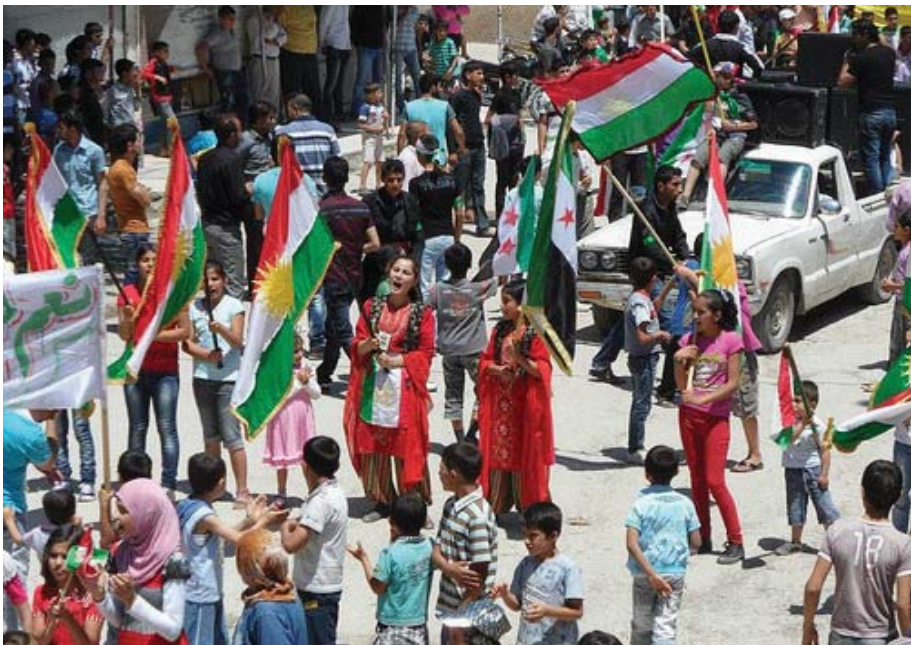
دیھەنیک لە زرگاریی شاری کوبانی خوراوی کوردستان لە چنگی رژی می بەشار نەسەد