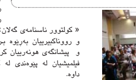
ئشه‌وه‌ی رۆژی یه‌کشه‌مه‌مه‌ ۱۹ ی پوه‌شه‌ر به‌به‌شه‌رداری سه‌دان که‌سه‌ له‌ رووناکبه‌ریان و هه‌ننه‌مه‌ندانی کورده‌ ده‌روه‌ی کوردستان . هه‌شته‌مین فسته‌قیالی دوو رۆژه‌ی رووناکبه‌ری به‌درخان له‌ پاریس . ناوچه‌ی سه‌فه‌ری کۆتایی پێ هات . حه‌مید شه‌وه‌ر به‌درخان . به‌رپه‌ری ده‌زگای