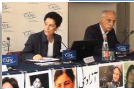
بێ سنوور . شه‌وه‌ به‌ تانه‌ شه‌هه‌ری که‌ له‌و کۆنفرانسه‌دا خه‌راوه‌ به‌ر باس بریتی بوون له‌ چاوه‌مه‌نیی نازادیه‌ .