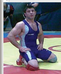
له‌ کچه‌یه‌کی یاریه‌کانی زۆرانبازی فه‌ره‌نگی له‌ ولاتی ئالمان . شه‌وه‌ ئه‌یوب ئازمووده . شه‌هه‌ری پشه‌وری ته‌می میلی ئه‌زان توانی له‌ کیشه‌ی ۸۵ کیلو دا پله‌ی به‌که‌می بوخۆی ده‌سه‌ته‌ به‌ر .