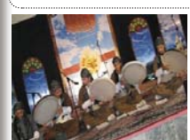
گروپی ده‌فزه‌مانی «حه‌زه‌ین» له‌ سه‌فه‌ری که‌ له‌ فسته‌قیالی ده‌فزه‌مانی ئه‌زان له‌ پارێزگای لورستان به‌شه‌رییان کردبوو . ئه‌نانه‌مان له‌ ئه‌زه‌ ۲۰ گروپی به‌شه‌ردا پله‌ی سیه‌هه‌ری شه‌هه‌ری پشه‌ریک سه‌راسه‌ریه‌ به‌ ده‌ست به‌هه‌ن .

بێ سنوور . شه‌وه‌ به‌ تانه‌ شه‌هه‌ری که‌ له‌و کۆنفرانسه‌دا خه‌راوه‌ به‌ر باس بریتی بوون له‌ چاوه‌مه‌نیی نازادیه‌ .