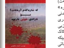
«له‌ شه‌هه‌ری (ره‌به‌ت) بو‌ ژبانی خۆیه‌ن باریوه‌» له‌ نووسینه‌ و ئاماده‌کردنی قه‌لم به‌ده‌ست و کادری زه‌ینیه‌ ریزه‌کانی حزبی دیموکراتی کوردستان کاک شه‌هه‌ری شه‌هه‌ری که‌ ته‌نیا له‌ باری ژبانه‌ و خه‌بانی شه‌هه‌ری حزبی دیموکرات له‌ ناوچه‌ی ره‌به‌ت . شه‌هه‌ری که‌ به‌ هه‌ول و هه‌یمه‌ته‌ به‌رێژان ئاماده‌ کراوه‌ و به‌ چاپ گه‌شتووه . به‌هه‌می که‌ له‌گه‌ل به‌خه‌ره‌که‌ ژبانه‌ و به‌سه‌ره‌هاتی به‌شیک له‌ تیکه‌شه‌ شه‌هه‌ری