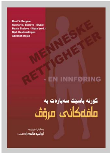
ګورته باسیګ سهارهت به مافه ګانی مروڤ

په ګرته وه ګان، سیسیسیه کان، بهزی مافه کان مروڤ، ټه ته وه په ګرته وه ګان، سیسته مه ناوچه یی ګانی پاریزګاری له مافی مروڤه، شوړای ټوروپا، ریکخراوی ټه منیهت و هاوکاری