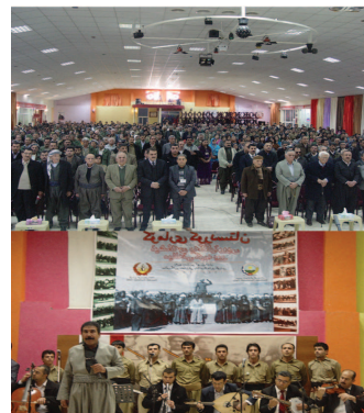
حیزبی دیموکراتی کردستان له به‌رنامه‌یه‌کی تاییه‌تی 65 ساڵی دامه‌زرانی گۆماری کردستانێ کردی حیزب و به‌و یۆنه‌یه‌وه ریوهرسمی به‌شکوێ به‌ریوه‌ بره‌ له‌و ریوهرسمه به‌شکویدا که دانیوه‌بوو رۆژی شه‌مه، 2 ی ریه‌ندان له شاری کۆیبه و به‌ به‌شداریی زیاتر له 700 کس له نوێنه‌رانی حیزبه کردستانییان، که‌سایه‌تییه سیاسی و رووناکجیرییه‌کان، کادر و پیشمه‌ره‌گه‌کان و نه‌ندامانی حیزبی دیموکراتی کردستان له باشووری کردستان به‌ریوه چوو، ریز له 65 ساڵی دامه‌زرانی گۆماری کردستان و دامه‌زرانه‌رانی ئه‌و

به‌یکه‌ که تیکۆشه‌رانی دیری نیو ریزه‌کاتی حیزبی دیموکراتی کردستان‌با‌ه‌نتیک له ژیر نای «گۆماری کردستان به‌رهمی که‌شه‌کردنی بیر ناسیونالیستی» به‌ریزبان له سه‌ره‌تای باسه‌که‌یدا به‌ ئاماژه‌دان به‌ ره‌چاوکردنی سیاسه‌تی توانه‌وه‌ی کورد له لاین ده‌سه‌لاتی ره‌زاخانیه‌وه که‌ دیه‌یه‌وست به‌ توانه‌وه‌ی نه‌ته‌وه‌ی کوردو نه‌ته‌وه‌کاتی دیکه له نه‌ته‌وه‌ی فارسی