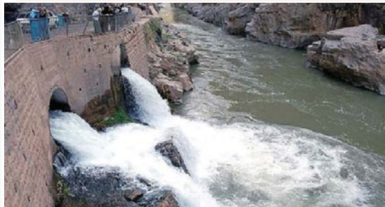
بکه ن، جیا له وهش که قازانجی کانی بل له ئیستادا بۆ خه لک زیاتر له لیدانی به نداوی داربانه.

«کانی بل» کانیه کی سه روستی له نزیکه ی گوندی هه ججه وه له کیوه کانی شاهووه سه رچاوه ده گری. کانی بل له چرکه یه کدا سنی تا چوار هزار لیتر ئاوی هه یه و ده توانی ئاوی خوارده وه ی دوو میلیون که س دابین بکا.