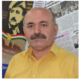
رهزا محهمه دهه مینه