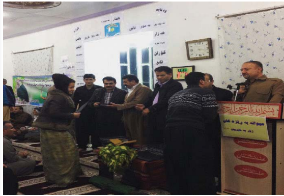
فیترخوازان و به شداریووانی ئەم خوله ی فیتربوونی زمانی کوردی دابهش کرا.

له گوندی ئالۆتی بانه زیوره سمیک بۆ به خشینی بروانامه ی کوتایی ده وه ی زمانی کوردی له لایه ن فیترگی زمانی کوردی سوما به ریوه چوو. له و ریوره سمه دا که هه ینی شه و، ۲۷ ی سه رماوه زو به به شداریی شاعیران و ئەدیبان و جه ماوری شاری بانه، بۆکان، سه رده شتو سه قزو خه لکی گوندی ئالۆت به ریوه چوو، به ده سپیشخه ری ئەنجومه نی ئەده بیی هاژوه فیترگی زمانی کوردی سوما شه وه شیعریک ریترخراو و بروانامه ی کوتایی خولی فیترکاری زمانی کوردی سوما پیشکش به به شداریووانی ئەو خوله کرا.